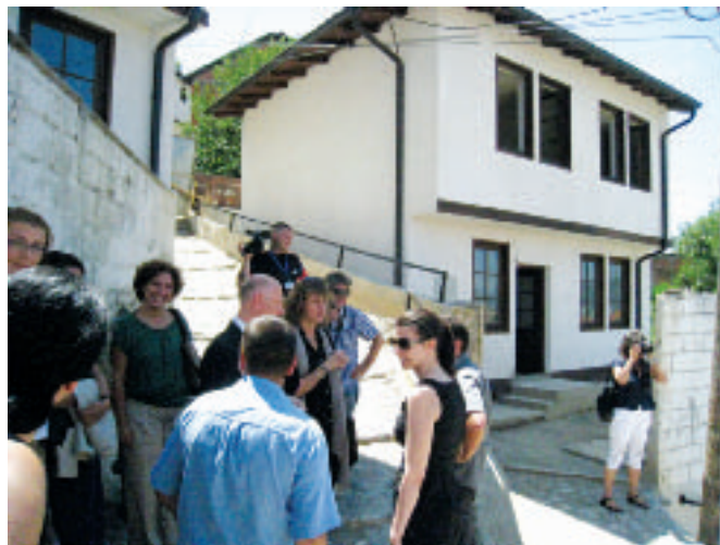
Обилазак завршених кућа

"Општина ће у сарадњи са Министарством за заједнице и повратак урадити и тај посао, као и ситније поправке електро и хидро-инсталације за које повратници кажу да