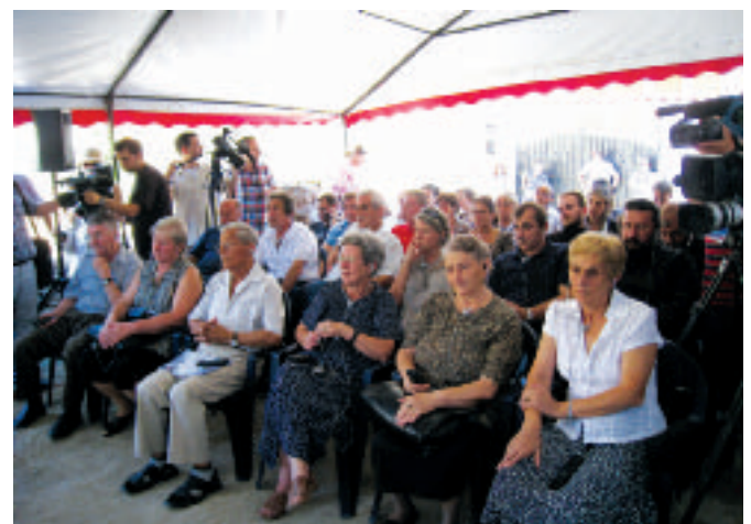
... повратници, гостии и медији.