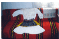
Nošnja iz Planjana

Stajkovce su posetile 2 osobe. U selu su oduvek živeli samo Srbi. Danas u njemu nema stanovnika.