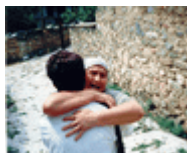
Sa svakog putovanja izrađuju se fotografije i video snimci