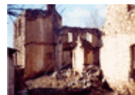
Uništene su dve srpske kuće.

Sredsku , administrativni centar, posetilo je 56 osoba. Od juna 1999. godine u selu nema Srba. Većina kuća je neoštećena. Selo je pod zaštitom jedinice KFOR-a koja je smeštena u školi, što garantuje bezbednost povratnicima. Povratak Srba u Sredsku značio bi veliki napredak u procesu povratka u Prizrenski region. Selo je oduvek bilo nastanjeno samo Srbima.