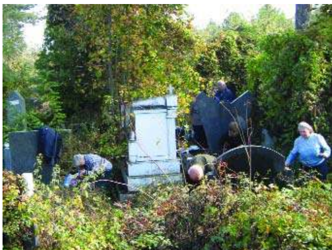
Задушнице, Призрен, новембар 2005. године A Requiem, Prizren, november 2005.