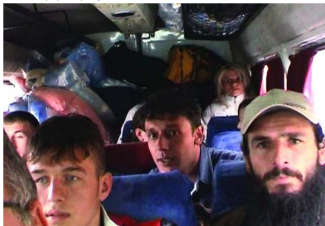
У минибусу на путу ка својим кућама

Уз десет младих интерно расељених лица, по пет из сваког од наведених села, групу, која се почетком новембра упутила у овај део Метохије, чинила су и два представника НВО "Југ" Краљево. Ова организација, заједно с партнерском НВО "Syuri i Vizionit" Пећ, је и најзаслужнија што је уопште дошло до ове посете, која се, иначе, одвијала у оквиру пројекта "Continuance of Action Plan Materializing through contacts increase", који се проводи под покровитељством Косовског иницијативног програма (KIP) - Данског савета за избеглице (DRC)- Приштина.