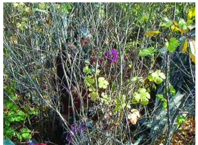
У појрази за брајовим гробом, Приштина, новембар 2005. године In searsh for brother s grave, Pristina, November 2005.