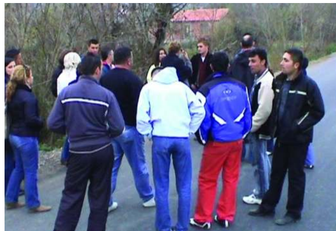
Дружење младих у Видању

Како би лакше заборавили непријатне сцене, а поштујући и друге зацртане активности, пут нас је довео до села Видање. Сусрет с вршњацима из овог села, учесницима посете повратио је расположење. Кроз разговор о условима живота стигли су до Омладинског центра који се још увек налази у фази изградње. Млади из Видања сматрају да ће им, по завршетку радова и опремању цен-