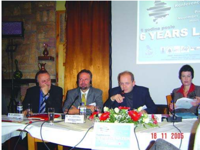
Конференција Шест година после, Приштина The Conference Six Years Later, Pristina