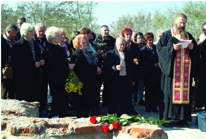
Парастас на гробљу у Ђаковици

Срби прогнаници обишли су гробља у Приштини, Пећи, Призрену, Клини, Истоку, Косовској Митровици, Обилићу, Косову Пољу и Ђаковици. Аутобуси са расељеним лицима кренули су пут Косова и Метохије из правца Београда, Смедерева, Крушевца, Краљева, Лазареваца, Ниша и других градова централне Србије.