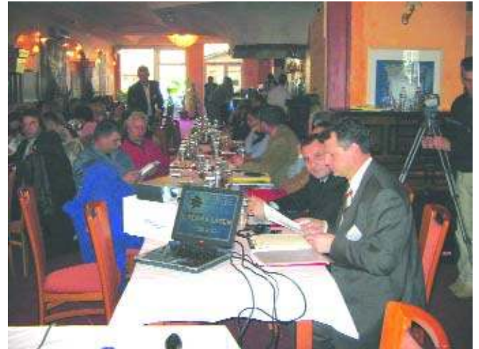
Дейал са конференције у Приштини A moment from the Conference in Pristina