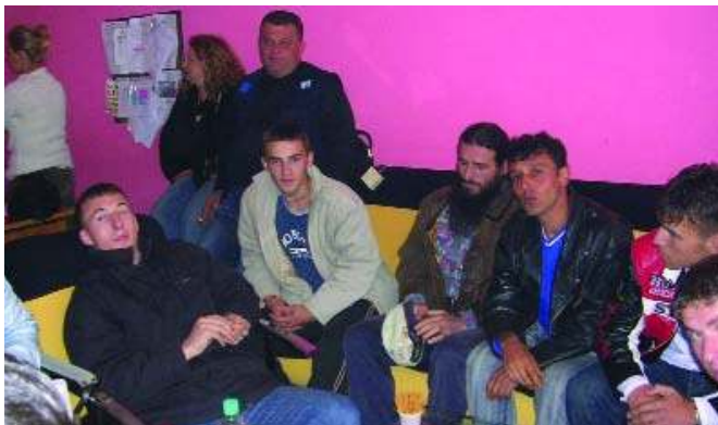
У њојсјети НВО Пећ

Наредног дана млади су посетили град Пећ и тамошњу невладину организацију "Suri Vizionit" која у сарадњи са "Југ"-ом реализује пројекат са младима из албанске заједнице, у селима Кош и Берково. Затим је посећена и канцеларија DRC-а у Пећи. Љубазни