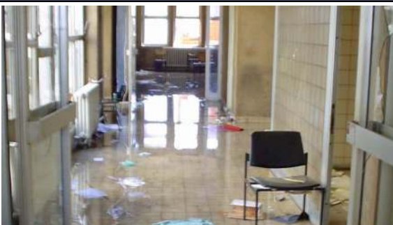
Дом здравља у Косову Пољу