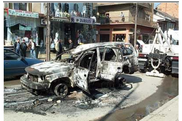
Унишћена возила UNMIK-а у Приштини