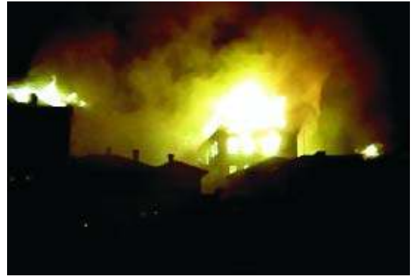
Црква Св. Ђорђа у Јиламену