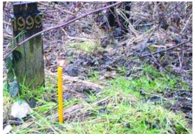
Хришћанско милосрђе - свећа на необележеном гробу

Долазимо први на збориште. Јављамо се међународној полицији.