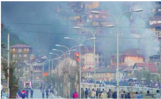
Призрен, 17. март