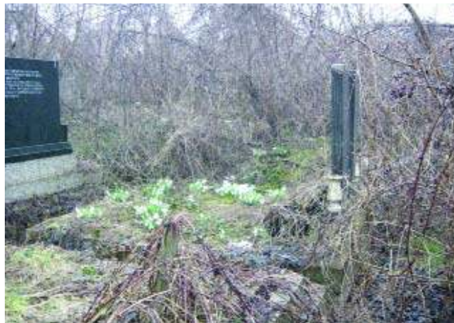
Висибаве на гробу

Приближавајући се Београду, људи се интересују да ли може опет да се обрати Координационом центру за посету гробљима о Духовским Задушницама. Јер, треба се борити да се успостави и одржи традиција да се макар гробља обилазе. Да се остави по струк босиока сланом туге покривен.