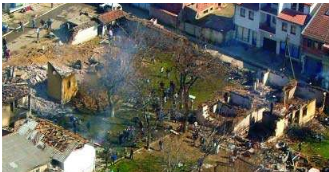
Место где се налазила црква у Баковици