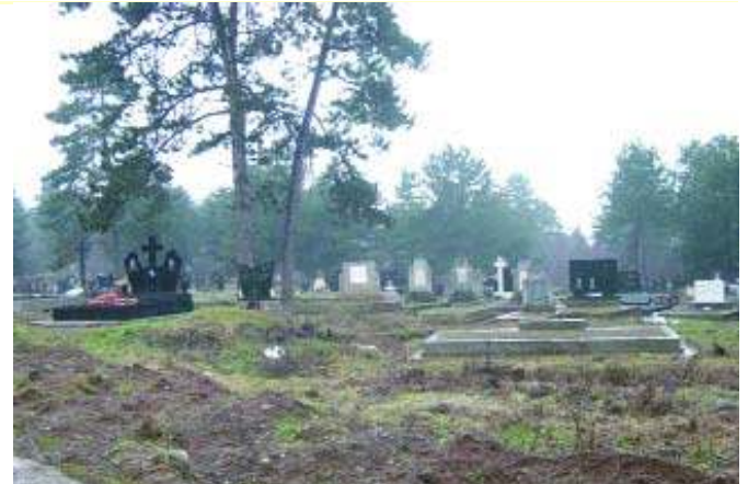
Поглед на православно и католичко гробље у Призрену које раздваја само једна стуба

да се и ту и у друга места посете овакве врсте одвијају преко транзитних путева, да се не би Албанци узнемиравали.