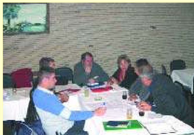
Детаљ са радних група

који су их изабрали да учествују у ОРГ и да они тамо морају представљати заједнички интерес, а не лични. Учесници овог скупа као позитивне примере постојања ОРГ истакли су следеће: успостављање контаката са албанском заједницом на Космету; међусобну размену информација; упоз-