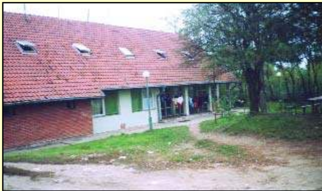
Колективни центар Чарда