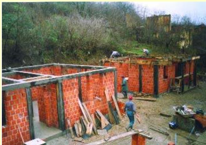
Смаћ, децембар 2004.

Повратак, обнова и боља информисаност су и даље наши приоритети. Међутим, треба имати у виду да је све већи број расељених дубоко загазио испод црте сиромаштва. Они немају посао, већина њих живе као подстанари или у колективним центрима, немају решена питања здравственог и социјалног осигурања, лоше су информисани о стању на Косову и Метохији, али и о својим правима у местима привременог боравка. Сваки од набројених сегмената је у неку руку наш приоритет, да, ако ништа друго, бар покушамо да јавно укажемо на њега. Када говоримо о повратку и обнови порушених кућа, већ на првом кораку се сусрећемо са проблемима који нису мали. Пре свега мислим на безбедност повратника и сло-