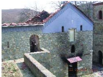
Манастир Девич, март 2004.