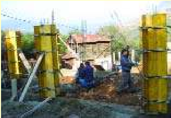
Стајковце, новембар 2004.

Стајковце, село у Средачкој Жупи, општина Призрен, ових дана је велико градилиште. Уз подршку удружења "Свети Спас" и Норвешког савета за избеглице (NRC), протеклог месеца се у ово место вратило 36 интерно расе-