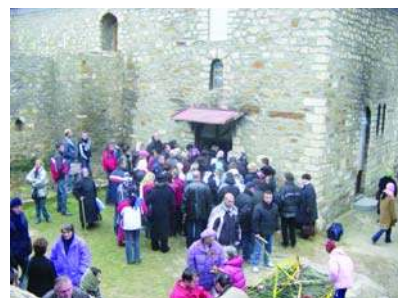
Манастир Девич, 15. децембар 2004.

До манастирске славе, 15 децембра, оспособљена је црква и нови конак. А на славу се стекло пет владика, много монаха и монахиња, као и верног народа да са радошћу посведоче ново васкрсње старе светиње.