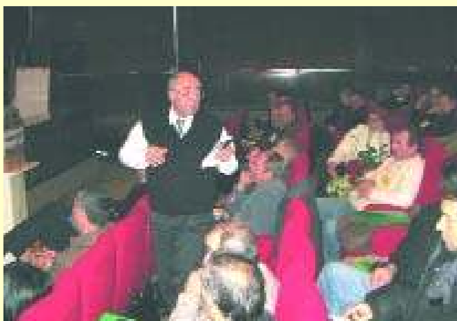
Детаљ са пленарног заседања

Непосредно по отварању овог скупа, новоизабраним представницима ИРЛ у ОРГ, о њиховој улози, процесу повратка и неким другим битним питањима везаним за овај процес, обратили су се представници UNHCR-а и UNMIK канцеларија за повратак и заједнице. Најзанимљивији предлози стизали су након рада по групама. На њима су, после садржајне дискусије, лоцирани највећи пропусти у досадашњем раду ОРГ, истакнуте добре стране и дати предлози на који начин се може побољшати њихов рад. Истакнуто је да су недостаци у самом раду ОРГ њихова слаба припремљеност, не добијање дневног реда на време, нередовно прослеђивање извештаја и записника након одржаних седница. Посебно