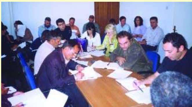
Општинска радна група, Косово Поље, новембар 2004.

Представници удружења "Божур" велику пажњу поклањају учествовању расељених лица на Општинским рад-