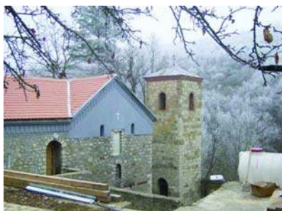
Манастир Девич, децембар 2004.

Рушевине манастира и црква сведоче о њиховим страдањима. Манастир Девич и његова историја говоре о мучеништву ове светиње, коју су рушили и која је опет васкрсавала.